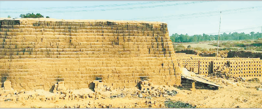
गमला ईट भट्टा में बनाए गए ईट।

रामानुजनगर क्षेत्र के ग्रामीण क्षेत्रों के गांव में नियम को ताक पर रखकर अवैध तरीके से गमला ईट भट्टा का धड़ल्ले से संचालित की जा रही है। इन क्षेत्र में ईट बनाने के लिए अवैध रूप से मिट्टी की खुदाई की जाती है जिससे राजस्व को अनावश्यक हानि होती है। हैरानी की बात यह है कि इन क्षेत्रों में कई जगह गमला ईट भट्टा का संचालन कई वर्ष से हो रहा है परंतु जांच व कार्रवाई के नाम पर आज तक सिर्फ खानपुर्तिल ही की गई है। हालांकि कुछ लोग अपनी जरूरत व नए मकान निर्माण के लिए गमला ईट भट्टा लगाते हैं। परंतु अधिकांश लोग ऐसे हैं जो इनके आद में अवैध रूप से गमला ईट को व्यवसाय बना लिए हैं और