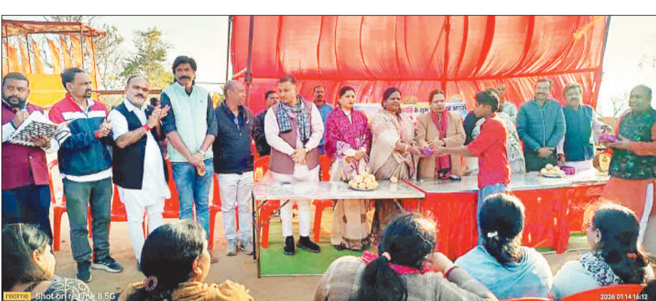
विजेता प्रतिभागियों को पुरस्कृत करते अतिथि।

खास बात विजेता प्रतिभागियों को प्रस्तुत किया गया पुरस्कृत गणपति धाम में भव्य पतंग प्रतियोगिता एवं तिलक गणपति धाम